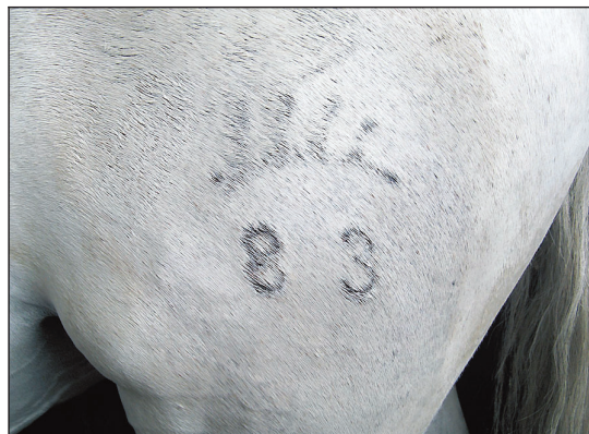
Links: Der Chip wird in der Mitte des Halses unterhalb des Mähnenkamms gesetzt. - Rechts: Die Zukunft des Schenkelbrandes ist derzeit noch völlig unklar.